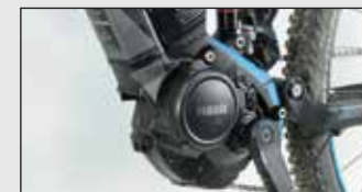
COD. 950.830.033 YAMAHA ENGINE PW SERIES

E CARACTERÍSTICAS TÉCNICAS - POLINI Hi-Speed es un dispositivo electrónico diseñado para el motor para e-bike con el objetivo de evitar la parada del motor a los 25 Km/h y en consecuencia mantener activa la asistencia hasta los 50 Km/h aprovechando al máximo las prestaciones que el motor puede ofrecer. Es facilísimo de instalar, ya que los conectores se adaptan directamente a los originales. La instalación se realiza en pocos minutos. No necesita configuración ya que se autorregula. Sin batería, puesto que se autoalimenta. Puede desactivarse de forma simple desconectando un imán. El velocímetro indicará siempre la mitad de la velocidad real, lo mismo que los km. Para saber la velocidad y km basta doblar la indicada. ESTE PRODUCTO DEBE USARSE DE ACUERDO A LAS LEGISLACIONES NACIONALES RELATIVAS AL TRÁFICO.